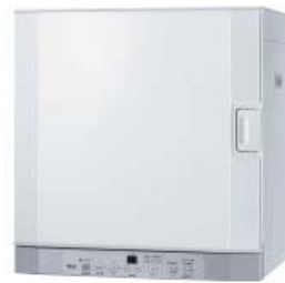
○乾太くん5kg デラックス RDT-52SA 00000 円