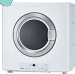
○乾太くん5kg デラックス RDT-52SA 00000 円